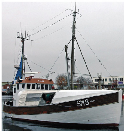
Bereits im kommenden Frühjahr wird der „Adler“ in seinen neuen Heimatstützpunkt nach Heiligenhafen verlegt.