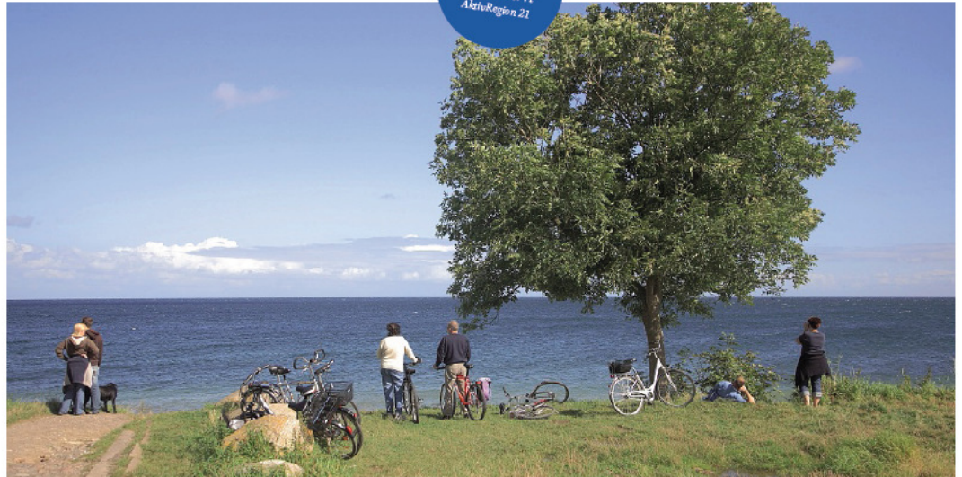
Fehmarn: In den kommenden Jahren soll die Erweiterung des Radwegenetzes vorangetrieben werden.