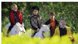
Besonders Reiten wirkt sich sehr positiv auf ADS/ADHS-Kinder aus.