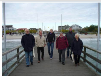
Bygd i samverkan inför nytt projekt