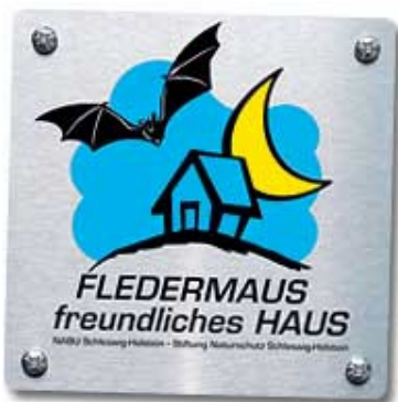
Plakette für ein fledermausfreundliches Haus www.fledermausfreundliches-haus.de

Der Kreis Ostholstein hat die Möglichkeit ‚fledermausfreundlicher Kreis‘ zu werden. „Dies ist ein absolutes Novum in Deutschland und daher ein Alleinstellungs-