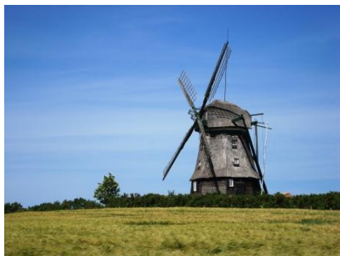
Mühle bei Farve