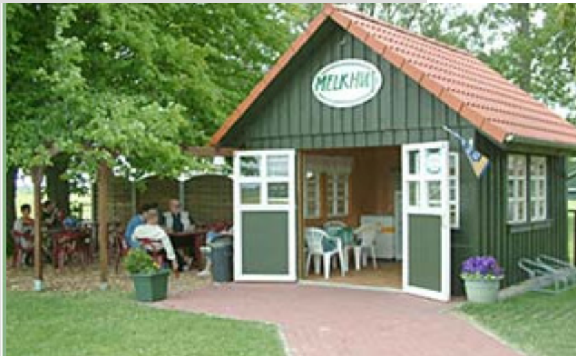
Oldenburg i. H., 11. Mai 2009