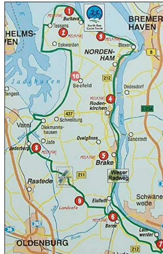
fotografierter Melkhus-Übersichtsplan; keine Urheberrechtsangabe vorhanden